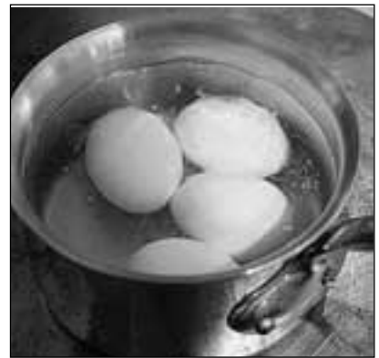
Кастрюля! Вот верное средство от неурядиц с яйцами!

На Физтехе тем временем стали чинить воду. Экскаватор ковшом по трубе